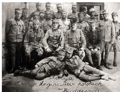
Legioniści przed budynkiem stacji zbornej w towarzystwie węgierskiego oficera.

Nie bez racji, bo w czasie I wojny światowej węgierscy ochotnicy uczestniczyli we wszystkich bitwach Legionów Polskich. Gdy zaś odrodzony naród polski toczył w latach 1918–1921 boje o kształt granic, Węgrzy znów okazali Polakom pomoc. W Legionach Polskich, utworzonych po wybuchu I wojny światowej, Węgrzy stanowili grupę narodowościową niewielką liczebnie, lecz znaczącą ze względu na swoje żołnierskie cechy. Udział Węgrów w Legionach był, oprócz wielkiej sympatii żywionej przez nich do Polski i Polaków, dowodem wdzięczności za zasługi gen. Józefa Bema i innych polskich ochotników w okresie Wiosny Ludów 1 .