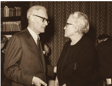
Kazimierz Wierzyński i Karolina Lanckorońska w Bibliotece Polskiej w Londynie, 1969 r.

Poglądy filozoficzne Lanckorońskiej wyrastały nie tylko z ogromnej wiedzy, lecz przede wszystkim z długich i zróżnicowanych doświadczeń życiowych. Pamiętała czasy sprzed I wojny światowej, a cesarza Franciszka Józefa oraz ministrów monarchii austro-węgierskiej poznała osobiście. Ze światem nowoczesnym zaznajomiła się jeszcze wszechstronnie – od salonów arystokratycznych i auli uniwersyteckich po przesłuchania NKWD i gestapo oraz pobyty w więzieniach i obozie koncentracyjnym; aktywnie przetrwała epokę zniewolenia jej rodzinnej Europy i dwukrotnie doczekała niepodległości Polski. Jej doświadczenia w przestrzeni geograficznej i kulturowej też są imponujące. Bardzo dobrze znała zachodnią Europę, długo żyła w państwach demokratycznych, ale dane jej było również zaznać rozmaitych form istnienia w ustrojach totalitarnych: rosyjskiego komunizmu i niemieckiego narodowego socjalizmu.