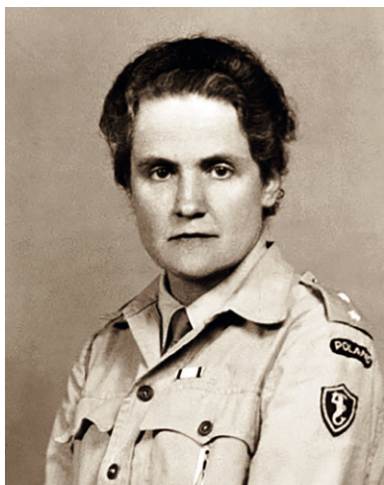
Karolina Lanckorońska we Włoszech jako oficer prasowy przy 2. Korpusie Polskich Sił Zbrojnych na Zachodzie, 1945 r.