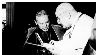
Prymas Stefan Wyszyński z Janem XXIII.