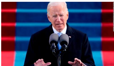
Joseph R. Biden - 46. prezydent