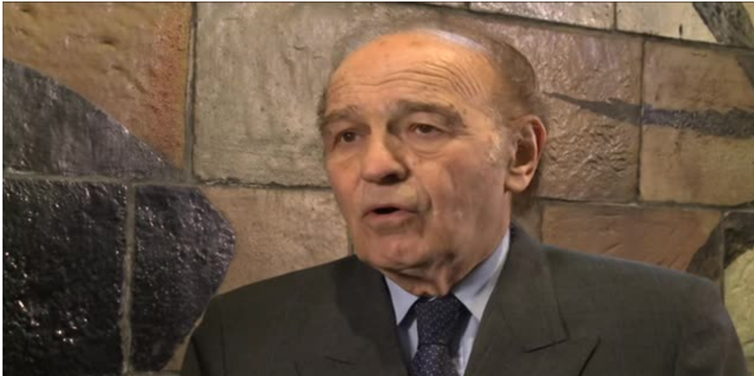
Samuel Pissar - światowa kariera chłopca z Białegostoku

https://przystanekhistoria.pl/pa2/tematy/usa/81407,Samuel-Pisar-swiatowa-kariera-chlopca-z-Bialelegostoku.html