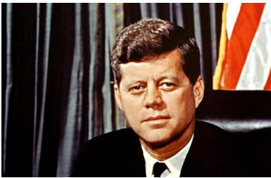
John F. Kennedy - 35. prezydent