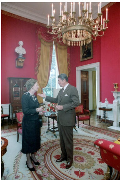
Pokój Czerwony Białego Domu, 1983. Prezydent USA Ronald Reagan rozmawia z premier

Druga wygrana Ronalda Reagana w wyborach prezydenckich w USA, która nastąpiła w listopadzie 1984 r., była bardziej efektowna niż pierwsza. Sukcesy na polu gospodarczym i międzynarodowym, a także sympatia obywateli, widoczna zwłaszcza po zamachu na jego życie z marca 1981 r., sprawiły, że mimo podeszłego wieku zdobył blisko 60 proc. głosów i zwyciężył swego konkurenta, Waltera Mondale’a, aż w 49 z 50 stanów.