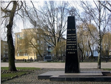
Pomnik Bohaterów Getta. Cmentarz żydowski w Białymstoku

Trzy spośród swoich wypraw Niemiec odbył do Wołkowyska, gdzie na przełomie 1942 i 1943 r. funkcjonował jeden z obozów zbiorczych, z którego sukcesywnie Żydów wywożono do Trebłinki. Aby wydostać odpowiednie osoby żydowscy lekarze najpierw aplikowali zastrzyk, po którym następowała utrata przytomności. Wówczas to – jako „nieboszczycy” – byli oni przewożeni na cmentarz. Tam odzyskiwali przytomność, przebierali się w chłopskie ubranie i wsiadali do samochodu.