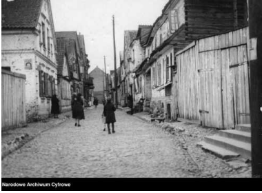
Ulica w żydowskiej dzielnicy Chanajki ( zniszczonej w czasie II wojny światowej), Białystok 1932 r.