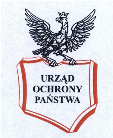
Logo Urzędu Ochrony Państwa