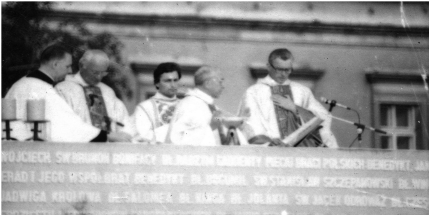
Uroczystości pogrzebowe, msze i modlitwy w intencji zmarłego prymasa polski ks. kard. Stefana Wyszyńskiego. Po środku kardynał Agostino Casaroli, pierwszy z prawej arcybiskup Franciszek Macharski, 31 maja 1981 r.

https://przystanekhistoria.pl/pa2/tematy/transformacja-ustrojowa/43069,Kardynal-Franciszek-Macharski-1927-2016.html