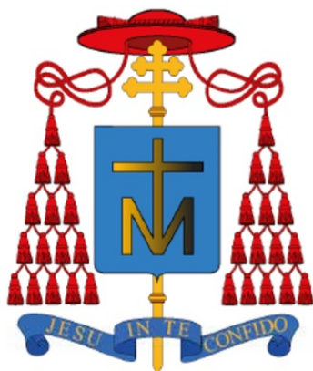
Herb kard. Franciszka Macharskiego - Jezu ufam Tobie.