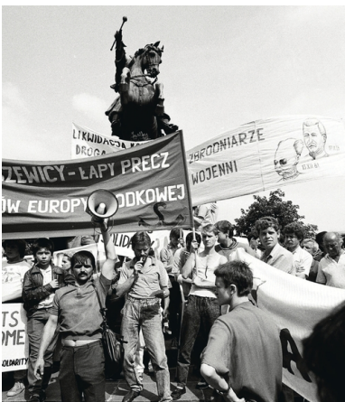
Demonstracja Solidarności Walczącej w czasie wizyty prezydenta USA George'a Busha