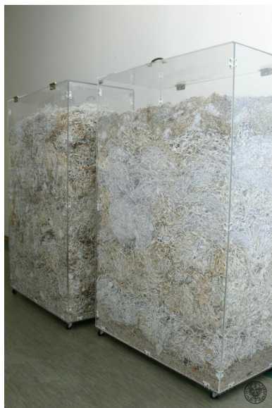
Gabloty ze zniszczonymi aktami służb terroru i represji PRL.

Tekst pochodzi z nr 1-2/2006 „Biuletynu IPN”