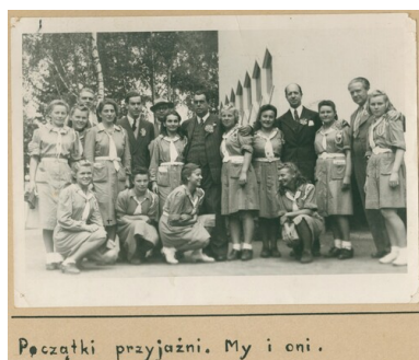
Karta z kroniki „Wędrownych Ptaków”, Fot. Chorągiew Łódzka ZHP