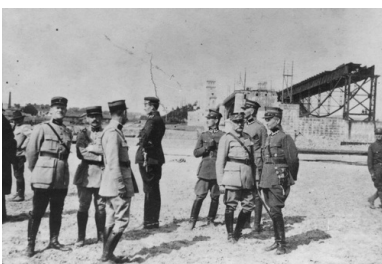
Członkowie francuskiej misji wojskowej z polskimi oficerami na plaży nad Wisłą. W tle odbudowywany most Poniatowskiego, 1920 r.