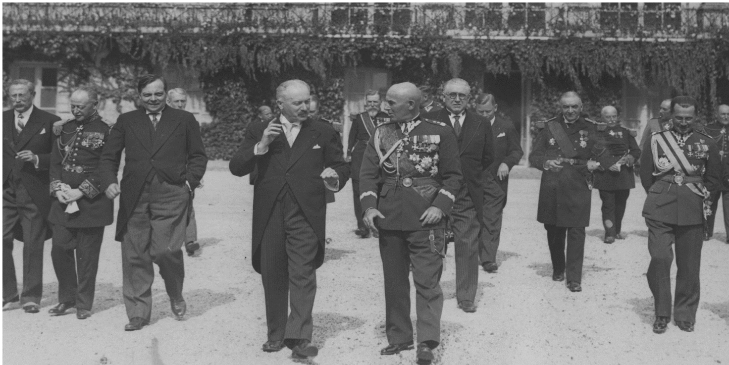
Wizyta Generalnego Inspektora Sił Zbrojnych RP generała Edwarda Rydza-Śmigłego we Francji, 1936 r.

https://przystanekhistoria.pl/pa2/tematy/stosunki-miedzynarodowe/94268,Polsko-francuski-sojusz-wojskowy-w-latach-1919-1939.html