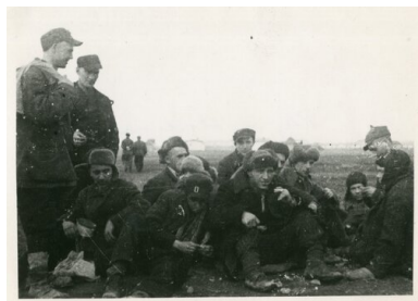
Raj - Stalina... Po „amnestji” (z odwoicia fotografii). Uwolnieni z łagrów sowieckich po przybyciu do Armii gen. Andersa, grudzień 1941 r.

Poważny problem z realizacją „amnestii” stworzyło zawężenie przez władze sowieckie pojęcia „obywatel polski” wyłącznie do osób narodowości polskiej. Przez kilka pierwszych miesięcy stosowania dekretu „amnestyjnego” zwalniano obywateli RP, nie bardzo zwracając uwagę na ich narodowość. Od grudnia 1941 r. obywatele innej narodowości niż polska przestali jednak być zwalniani. Gdy interweniowano w ich sprawie, padała odpowiedź, że jako nie-Polacy nie mogą być „amnestionowani”.