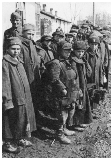
Polskie dzieci, po wyjściu z