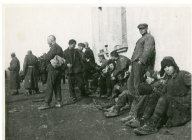
Raj - Stalina... Po amnestji - zbieramy się do kupy (z odwrocia fotografii).