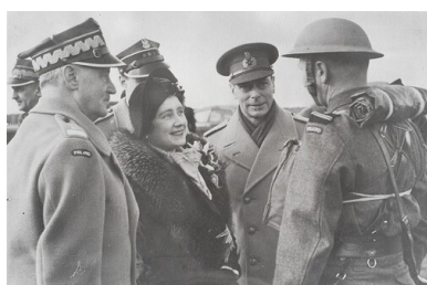
Premier Rządu RP na Wychodźstwie i Naczelnny Wódz Polskich Sił Zbrojnych gen. Władysław Sikorski w towarzystwie króla Anglii Jerzego VI i królowej Elżbiety.