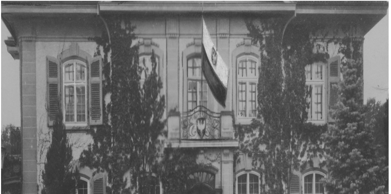
Gmach Poselstwa RP w Bernie

https://przystanekhistoria.pl/pa2/tematy/stosunki-miedzynarodowe/93719,Telegramy-czasu-wojny.html