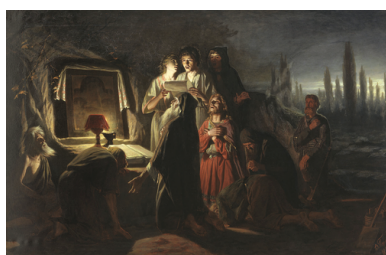
Pierwsi chrześcijanie w Kijowie - obraz Wasilija Pierowa, 1880 r. (fot. Wikipedia)

Aktywność Józefa Glempa należy postrzegać w kontekście szerszych uwarunkowań związanych z ówczesnymi relacjami między Związkiem Sowieckim a Stolicą Apostolską. Dojście do władzy Michaiła Gorbaczowa i zapoczątkowane przez niego reformy stwarzały możliwości poszerzenia obszaru wolności dla Kościoła w ZSRS. Dlatego aktywność prymasa Polski stała się częścią misji Stolicy Apostolskiej wobec Związku Sowieckiego i krajów Europy Wschodniej 1 .