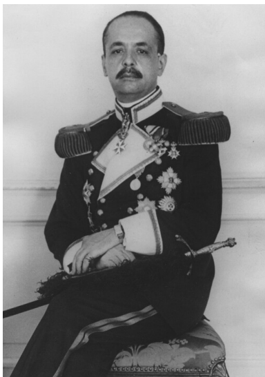
István Csáky, minister spraw zagranicznych Królestwa Węgier od grudnia 1938 r. do stycznia 1941 r. (do śmierci).