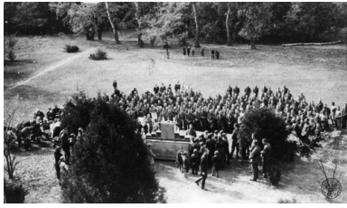
Pierwsza msza św. w obozie dla internowanych Polaków w Inarcskakucs (Węgry), 15 października 1939 r. Pośrodku - ołtarz.

MSW, którego Biurem do Spraw Uchodźców kierował wielki przyjaciel Polaków József Antall.