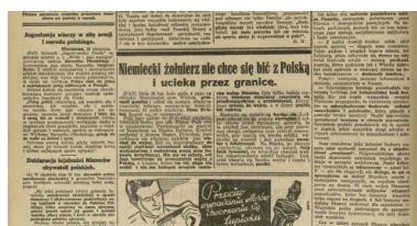
Ilustrowany Kurjer Codzienny, nr 240 z 31 sierpnia 1939 roku