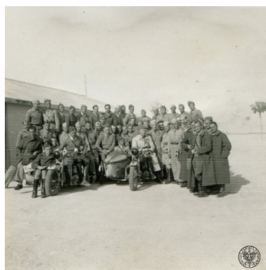
Żołnierze Samodzielnej Brygady Strzelców Karpackich na tle piramidy Chefrena w Gizie, luty 1941.