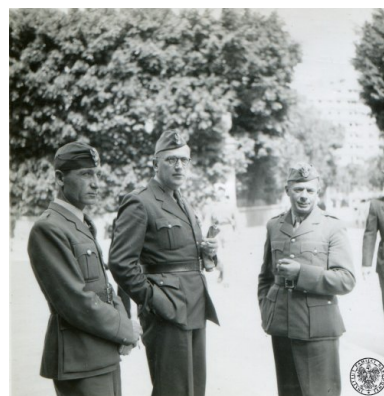
Żołnierze Samodzielnej Brygady Strzelców Karpackich przed kościołem św. Katarzyny w Aleksandrii w Egipcie, Wielkanoc