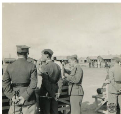
Żołnierze na widowni na meczu piłki nożnej między drużynami Samodzielnej Brygady Strzelców Karpackich i RAF w obozie w Abu