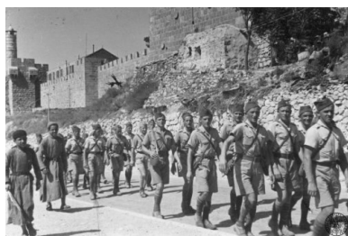
Wzdłuż murów Jerozolimy, podczas zwiedzania miasta, maszerują żołnierze 3. baterii Dywizjonu Strzelców Górskich Brygady Strzelców Karpackich, 29 lipca 1940. Żołnierze są w

Brygada dysponowała 1 444 zwierzętami pociągowymi i około 550 pojazdami mechanicznymi. Perspektywy obejmowały rozwinięcie brygady do stanu dywizji piechoty górskiej, ale te założenia nie zostały osiągnięte do 22 czerwca 1940 r., czyli chwili kapitulacji Francji.