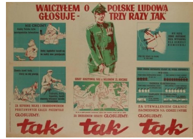
Przedreferendalna ulotka propagandowa