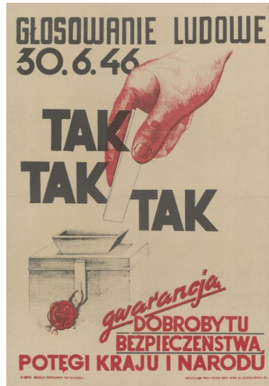
Plakat wzywający do głosowania 3 x Tak