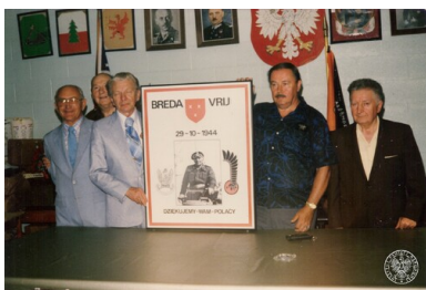
Mieszkańcy Bredy z pamiątkową tablicą "Dziękujemy Wam Polacy" z wizerunkiem gen. Stanisława Maczka.