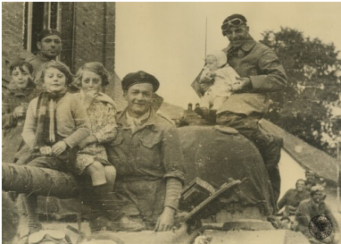
Polscy czołgiści i francuskie dzieci na czołgu M4 Sherman z 1. Dywizji Pancernej podczas postoju w wyzwolonej miejscowości we Francji.