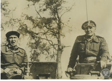
Dowódca 1. Dywizji Pancernej gen. bryg. Stanisław Maczek (P) we władze wieży czołgu, prawdopodobnie w rejonie Falaise (Normandia); sierpień 1944 r. Po lewej szef sztabu dywizji mjr (od 7 września ppłk) Ludwik Stankiewicz.