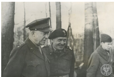
Naczelnny dowódca sił alianckich generał Dwight Eisenhower (1L) i dowódca polskiej 1. Dywizji Pancernej generał brygady Stanisław Maczek (2L) podczas inspekcji oddziałów polskich w Holandii. Listopad 1944 r.