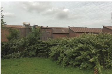
Zabudowania dawnej Huty „Baildon”, 2021 r.

dlatego huta ma się stać siedzibą jednej z grup regionalnego kierownictwa Związku.