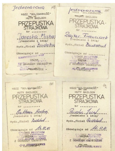
Przepustki strajkowe z Huty „Baildon”, 14 grudnia 1981 r.