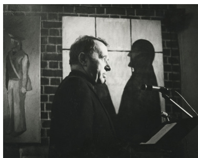
Ks. prof. Józef Tischner podczas wykładu towarzyszącego II Biennale Malarstwa Młodych Droga i prawda, kościół pw. św. Krzyża we Wrocławiu, 1987 r.