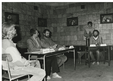
Przedstawienie teatralne „Proces Władysława Frasyniuka” w kościele pw. św. Wawrzyńca we Wrocławiu, 3 czerwca 1985 r.

Zaiste fenomenem był fakt zaproszenia pod ów kościelny parasol również osób, które nie identyfikowały się z religią, religijnością czy szeroko pojętym katolicyzmem, a nawet stały na jego rubieżach lub, co więcej, swoją twórczością prezentowały stanowisko dalekie od wykładni Urzędu Nauczycielskiego Kościoła. Wnętrza kościołów, salki parafialne czy wręcz prywatne mieszkania kapłanów stały się miejscem szerokiej prezentacji sztuki jak najbardziej współczesnej, twórczości żywo reagującej na otaczający świat i aktualne wydarzenia.