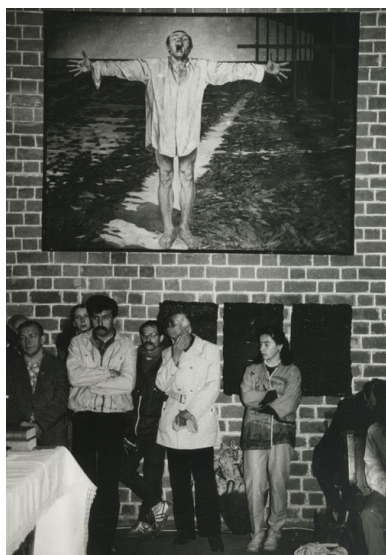
II Biennale Malarstwa Młodych Droga i prawda, kościół pw. św. Krzyża we Wrocławiu, 30 maja 1987 r.

Dla zdecydowanej większości Polaków to, co wydarzyło się w grudniową noc, było całkowitym zaskoczeniem. Wielu nie wierzyło, niektórzy z trudem tłumili gniew, większość obawiała się, co przyniosą kolejne dni. 16 grudnia 1981 r. brutalnie spacyfikowano strajk w katowickiej kopalni Wujek. Od strzałów z pistoletów maszynowych zginęło 9 górników.