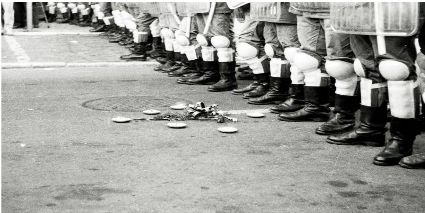
Stan wojenny. Przegrana bitwa

https://przystanekhistoria.pl/pa2/tematy/stan-wojenny/77120,Stan-wojenny-Przegrana-bitwa.html