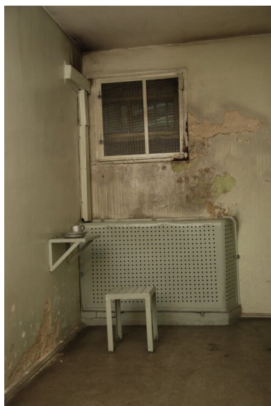
Areszt w KM MO w Katowicach przy ul. Kilińskiego, stan z 2011