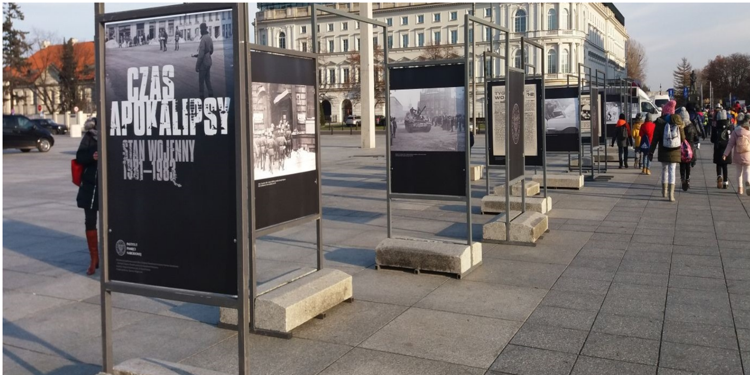
Wystawa IPN „Czas apokalipsy. Stan wojenny 1981-1983” - Warszawa, 12-19 grudnia 2019

https://przystanekhistoria.pl/pa2/tematy/stan-wojenny/60849,Najmlodszy-internowany-stanu-wojennego-jest-dzisiaj-historykiem-IPN.html