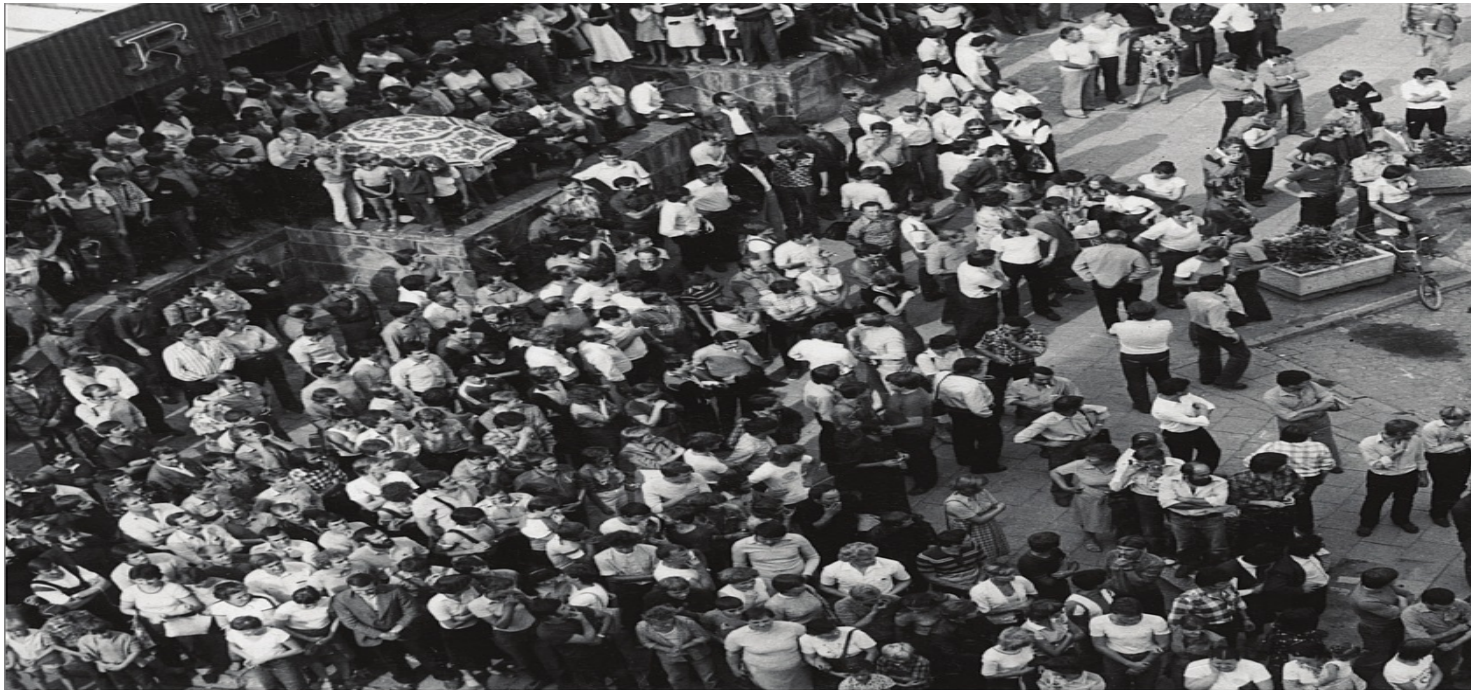
„Nielegalne zgromadzenie” na pl. Wolności. Zdjęcie operacyjne SB.

https://przystanekhistoria.pl/pa2/tematy/stan-wojenny/34909,Polowanie-na-ludzi-Zbrodnia-lubinska-31-sierpnia-1982-roku.html