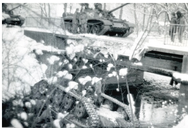
Załogi innych czołgów z 8 Drezdeńskiego Pułku Czołgów Średnich na moście w miejscu wypadku