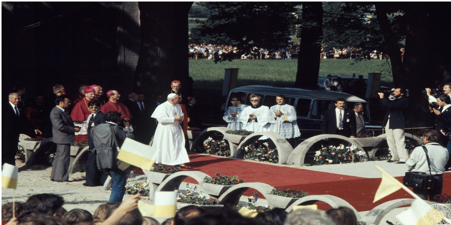
Jan Paweł II przed rozpoczęciem nieszpórów maryjnych na Górze Świętej Anny, 21 VI 1983 r. (fot. z zasobu IPN)

https://przystanekhistoria.pl/pa2/tematy/stan-wojenny/102439,Przywrocenie-nadziei.html