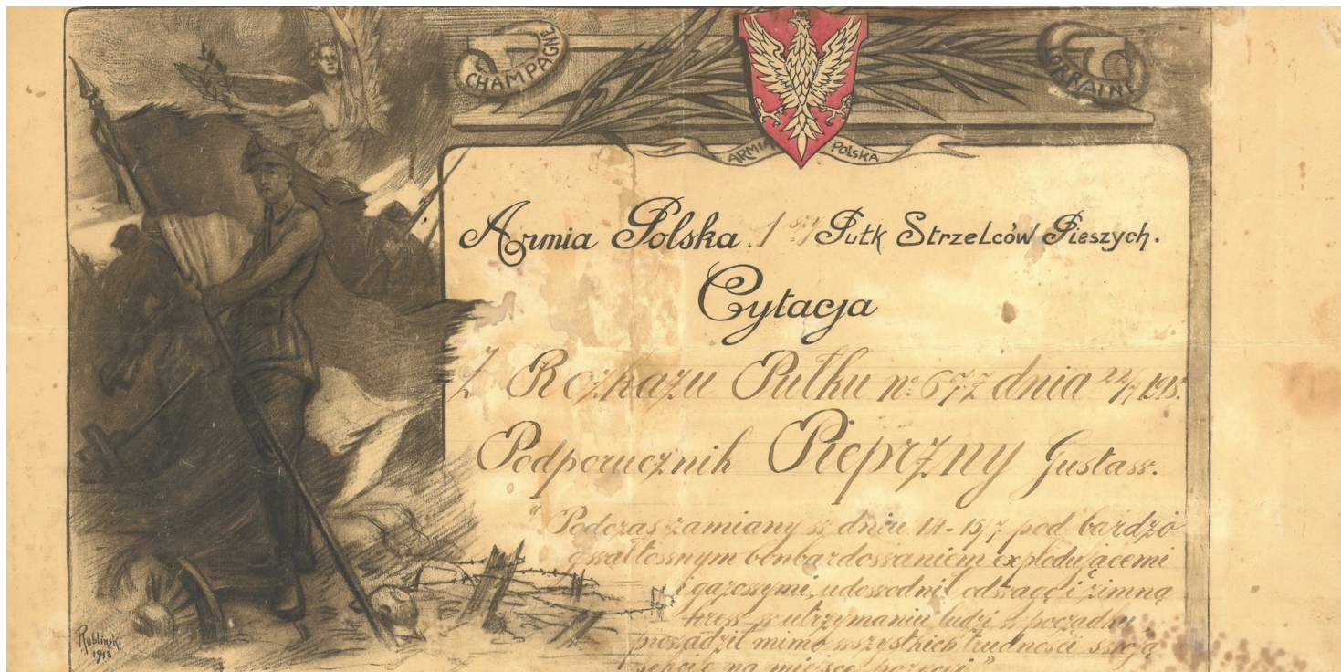
Dyplom z pochwałą wojskową zasług wojennych Gustawa Pieprznego w okresie służby w Armii Polskiej we Francji, 1918 r.

https://przystanekhistoria.pl/pa2/tematy/sport/103380,Gustaw-Pieprzny-Naczelnik-Sokolstwa-Polskiego-w-Ameryce.html