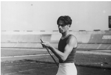
Eugeniusz Lokajski podczas przedolimpijskich zawodów lekkoatletycznych w Warszawie, czerwiec 1936 r.

Eugeniusz Lokajski przed wojną był sportowcem. Odnosił sukcesy jako wszechstronny lekkoatleta. Początkowo startował w zawodach pięcioboju i dziesięcioboju. W 1935 r. zdobył srebrny medal w pięcioboju na mistrzostwach świata w Budapeszcie. Spróbował wszystkiego, aby ostatecznie znaleźć dyscyplinę, w której był najlepszy. W 1936 r. ustanowił rekord Polski w rzucie oszczepem i wystartował w tej konkurencji na olimpiadzie w Berlinie. Na treningu przed zawodami olimpijskimi uzyskał rezultat 73,27 m, co było trzecim, wynikiem na świecie. Niestety kontuzja uniemożliwiła Lokajskiemu zdobycie wtedy medalu.