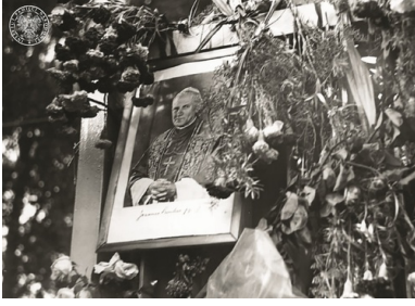
Portret papieża Jana Pawła II na bramie Stoczni Gdańskiej podczas strajku w sierpniu 1980 r.