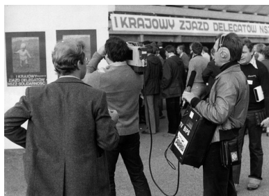
Operatorzy TV BIPS (Biuro Informacji Prasowej KKP NSZZ „S”) przed wejściem na halę widowiskowo-sportową "Olivia" w Gdańsku, gdzie odbywał się I Krajowy Zjazd Delegatów Niezależnego Samorządnego Związku Zawodowego "Solidarność", 1981 r.