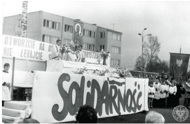
Msza św. polowa z udziałem działaczy NSZZ „Solidarność”, wiosna 1981 r.

widoczna w daleko idących postulatach zmiany systemu politycznego, ale przez większość okresu istnienia „Solidarności” wspomniana zbieżność poglądów i wpływ Kościoła były bardzo wyraźne i czytelne.