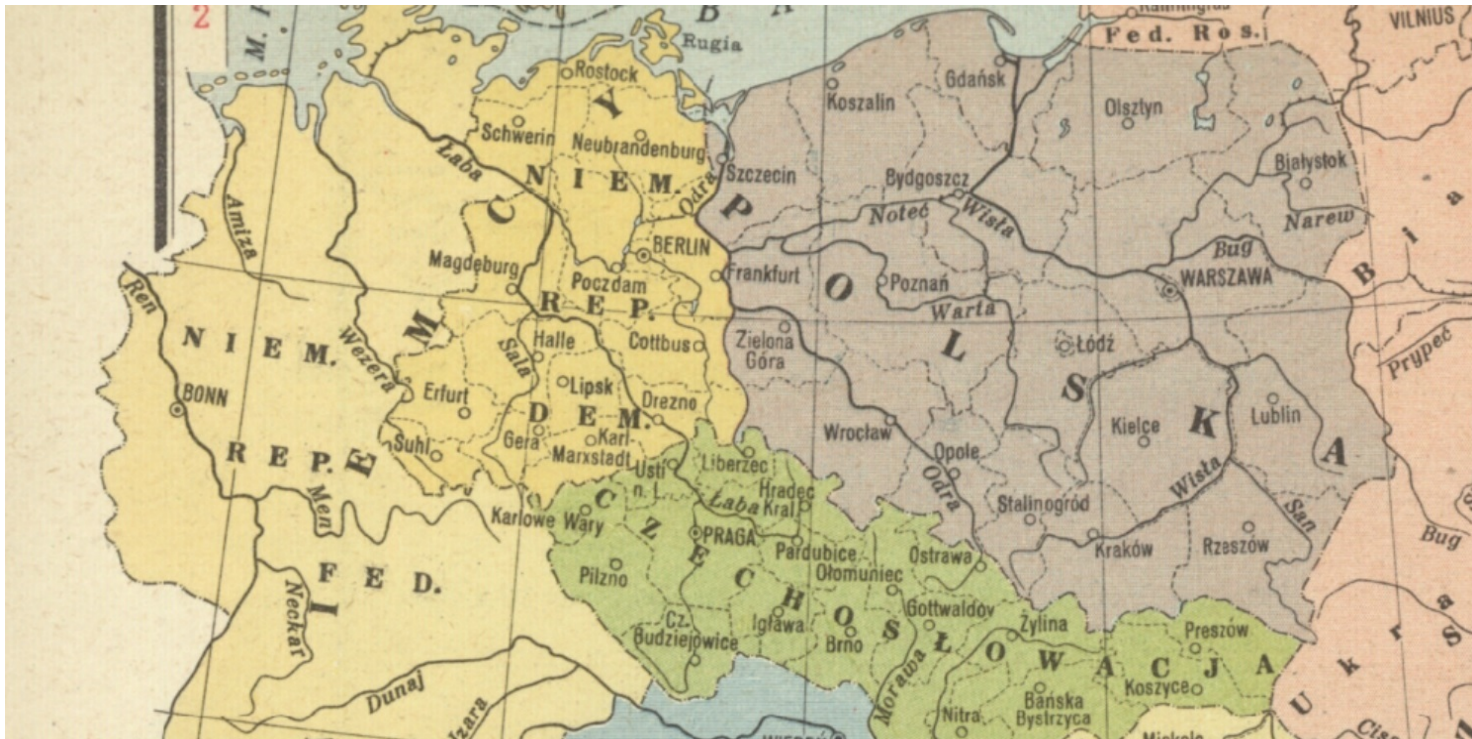
Państwa niemieckie i Polska na mapie politycznej Europy 1945-1990

https://przystanekhistoria.pl/pa2/tematy/solidarnosc/90182,Zmiażdżyc-kontrrewolucje-NRD-wobec-Solidarnosci.html