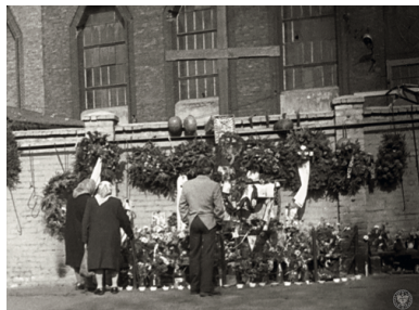
Zdjęcie z obserwacji przez SB ludzi gromadzących się pod krzyżem przy kopalni „Wujek”.

Ten krzyż, który towarzyszył górnikom z „Wujka” przez kilkanaście miesięcy tzw. karnawału „Solidarności”, został skradziony przez „nieznanych sprawców” 27 stycznia 1982 r. Górnicy, gdy tylko dowiedzieli się o kradzieży, zagrozili strajkiem, jeśli krzyż nie wróci na swoje miejsce. Sami wykonali nowy, bardziej masywny od poprzedniego. Powstał z dębowych prowadnic szybowych, wzdłuż których porusza się górnicza winda, czyli „szola”.