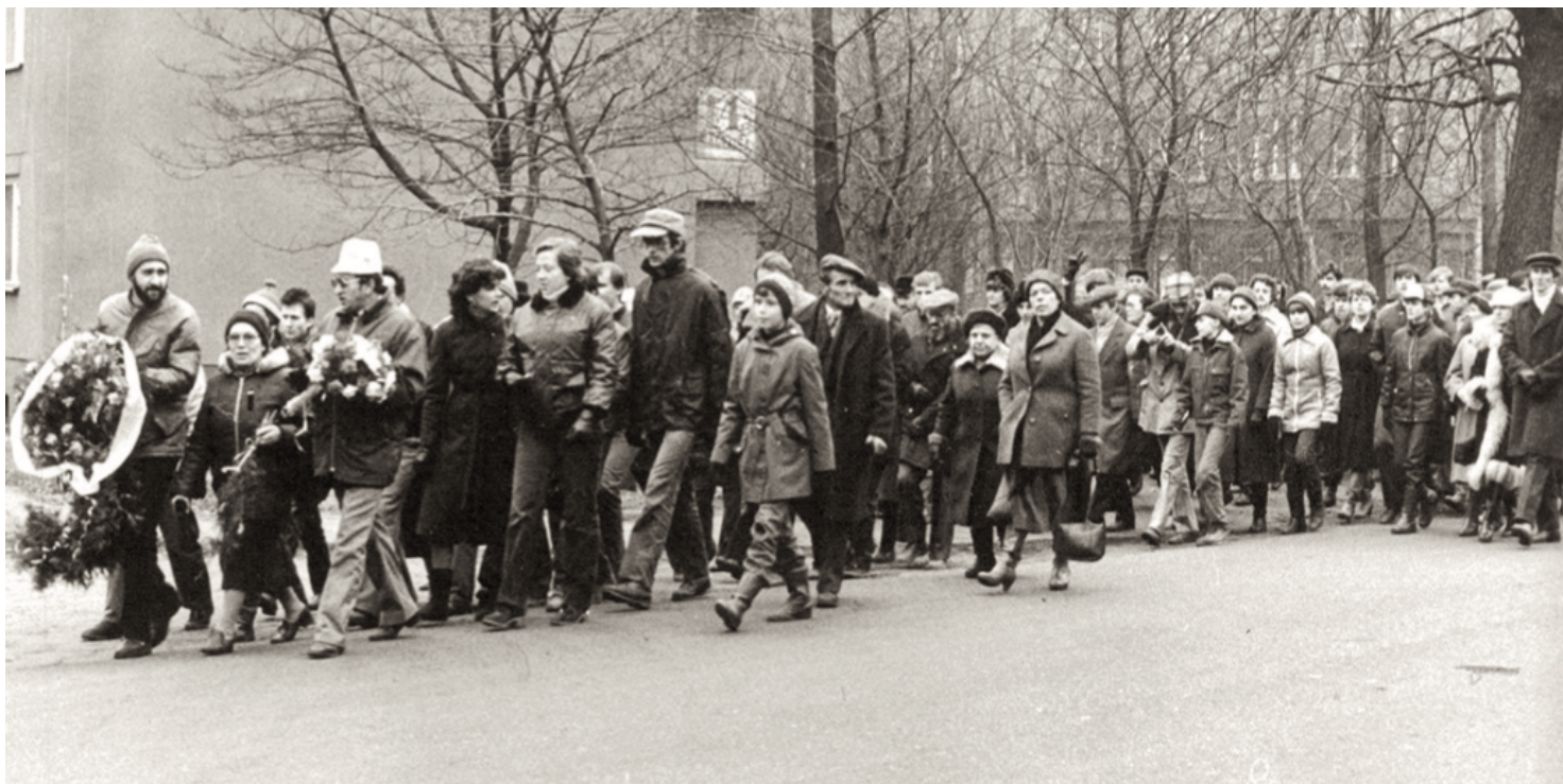
Anna Walentynowicz na czele pochodu idącego pod kopalnię „Wujek”; Katowice, 16 grudnia 1984 r.

https://przystanekhistoria.pl/pa2/tematy/solidarnosc/89405,Nielegalne-rocznice.html