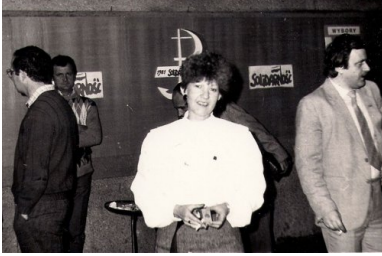
Spotkanie Komitetu Obywatelskiego „Solidarność” w Starachowicach.

parlamencie. Wokół takich założeń politycznych skupiła się duża grupa ludzi i to właśnie umożliwiło powstanie zorganizowanej struktury KPN-u w Kielcach.