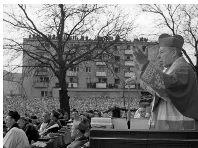
Prymas Polski głaszający homilię podczas obchodów Tysiąclecia Chrztu Polski w Gorzowie Wielkopolskim, 6 listopada 1966 r.