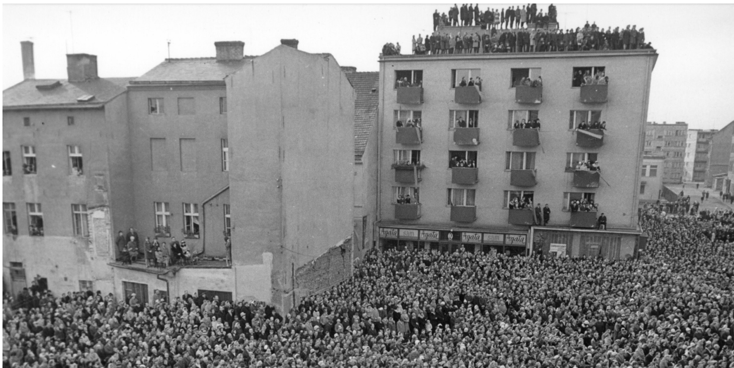
Obchody Tysiąclecia Chrztu Polski w Gorzowie Wielkopolskim, 6 listopada 1966 r.

https://przystanekhistoria.pl/pa2/tematy/solidarnosc/80179,Solidarnosc-w-Gorzowie-Wielkopolskim.html