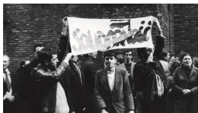
Demonstracja Solidarności przed katedrą św. Jana w Warszawie, 1 maja 1984 r.