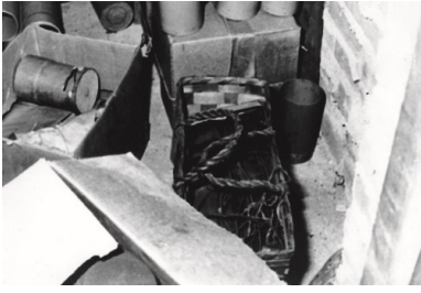
Urządzenia miotające ulotki. Fot.