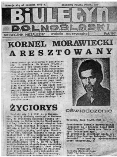
Biuletyn Dolnośląski (wydanie specjalne) z września 1981 r.