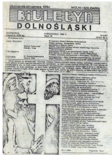
Biuletyn Dolnośląski z października 1985 r.