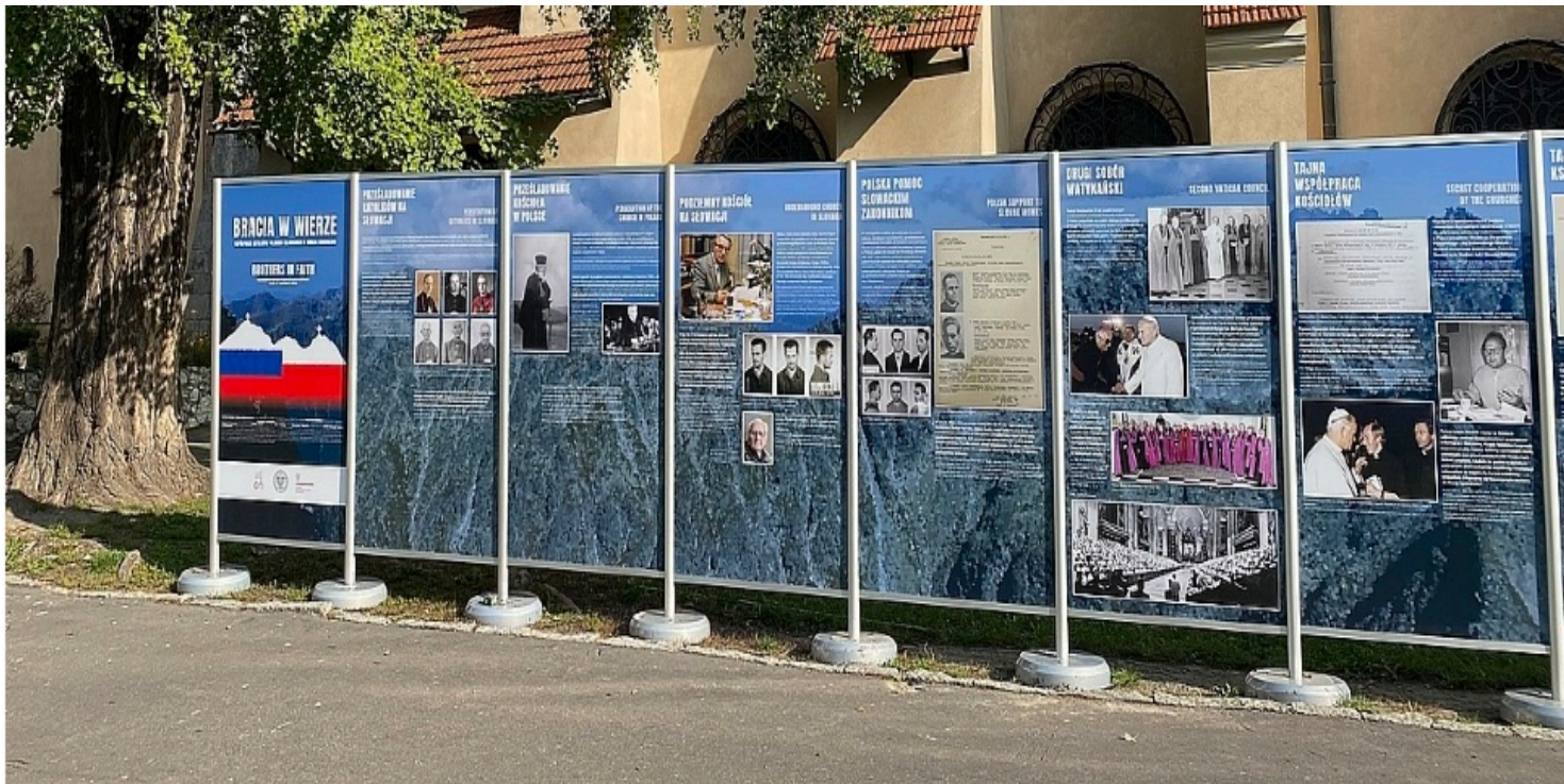
Wystawa „Bracia w wierze” w Krakowie.

https://przystanekhistoria.pl/pa2/tematy/slowacja/104886,Meczennik-komunizmu-Blogoslawiony-ks-Tytus-Zeman-19151969.html