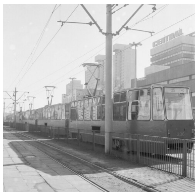
Centrum Łodzi - początek lat osiemdziesiątych XX w.

1 września po północy na ulice wyjechały pierwsze autobusy i tramwaje, a życie w mieście zdawało się powracać do normalnego rytmu. Przypomnijmy jednak, że strajki nie wygasły wraz z podpisaniem porozumień sierpniowych. Do licznych protestów dochodziło również w wrześniu. Ogółem pierwszych dni sierpnia do 3 października 1980 r. w województwie miejskim łódzkim strajkowało 65,5 tys. osób w 67 zakładach pracy. To dzięki nim w Łodzi i regionie mogła narodzić się „Solidarność”.