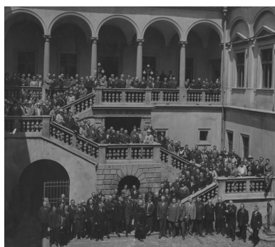
Walny Zjazd Towarzystwa Szkoły Ludowej w Krakowie, 26 lipca 1927 r.