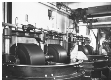
Wnętrze jednej z hal produkcyjnych fabryki czekolady i cukrów A. Piaseckiego S.A. w Krakowie, 1932 r.

niezadowolenia społecznego – najczęściej w formie strajków i manifestacji ulicznych. Były one tłumione przez policję. Do najbardziej dramatycznych wydarzeń doszło wiosną 1936 r. W marcu w Krakowie policja ostrzelała pochód robotników protestujących przeciw brutalnemu stłumieniu strajku kobiet w fabryce Semperit; zginęło osiem osób. Miesiąc później we Lwowie, w czasie demonstracji protestacyjnej po zastrzeleniu przez policję dwa dni wcześniej bezrobotnego, w czasie rozpędzania manifestantów od kul zginęło trzynaście osób.