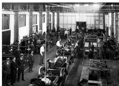
Fabryka samochodów General Motors w Warszawie - widok ogólny hali produkcyjnej, około 1930 r.