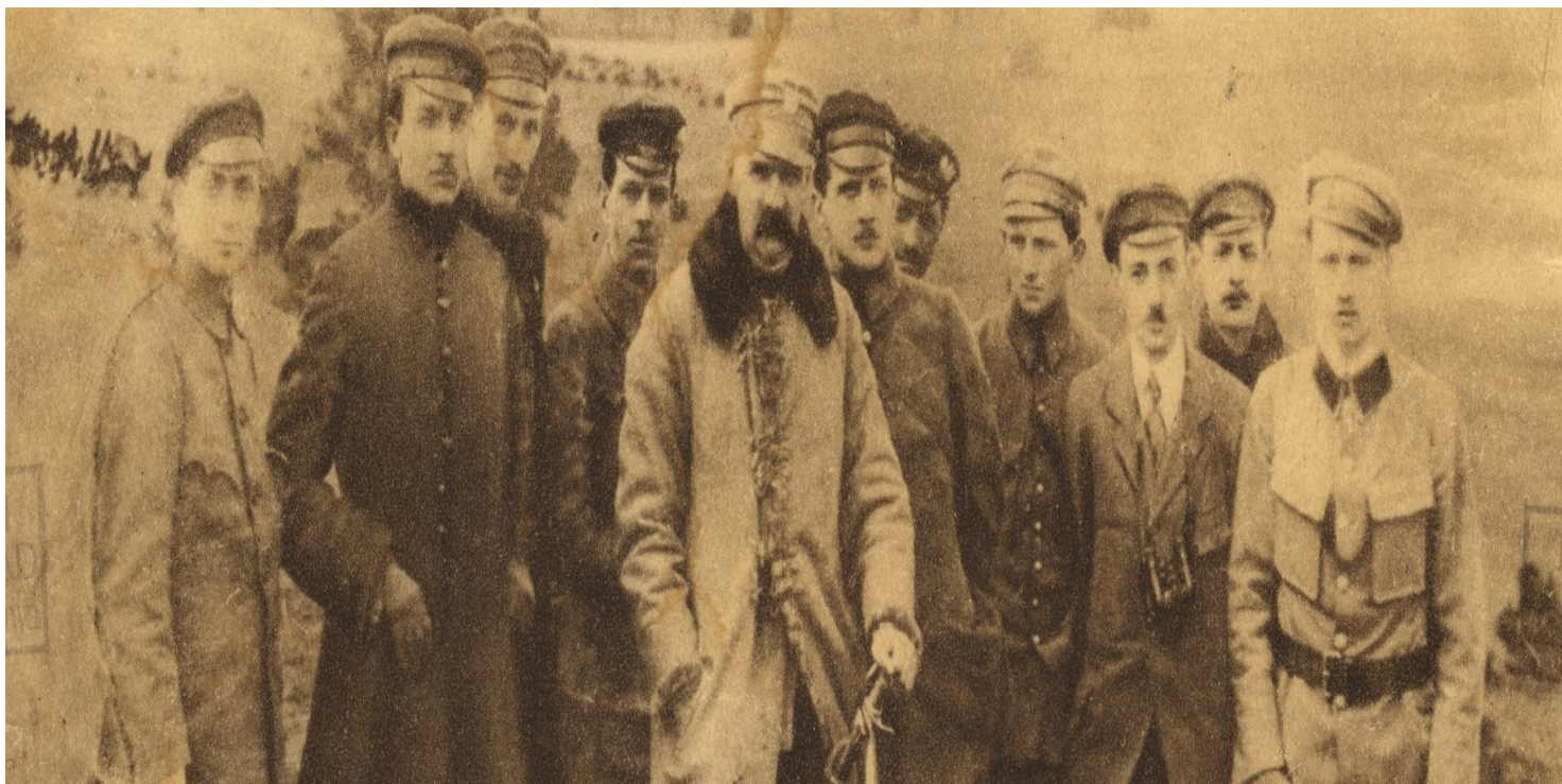
Józef Piłsudski wśród Komendy Naczelnej POW.

https://przystanekhistoria.pl/pa2/tematy/sanacja/67383,Umarl-Dziadek-siwy-a-zelazny.html