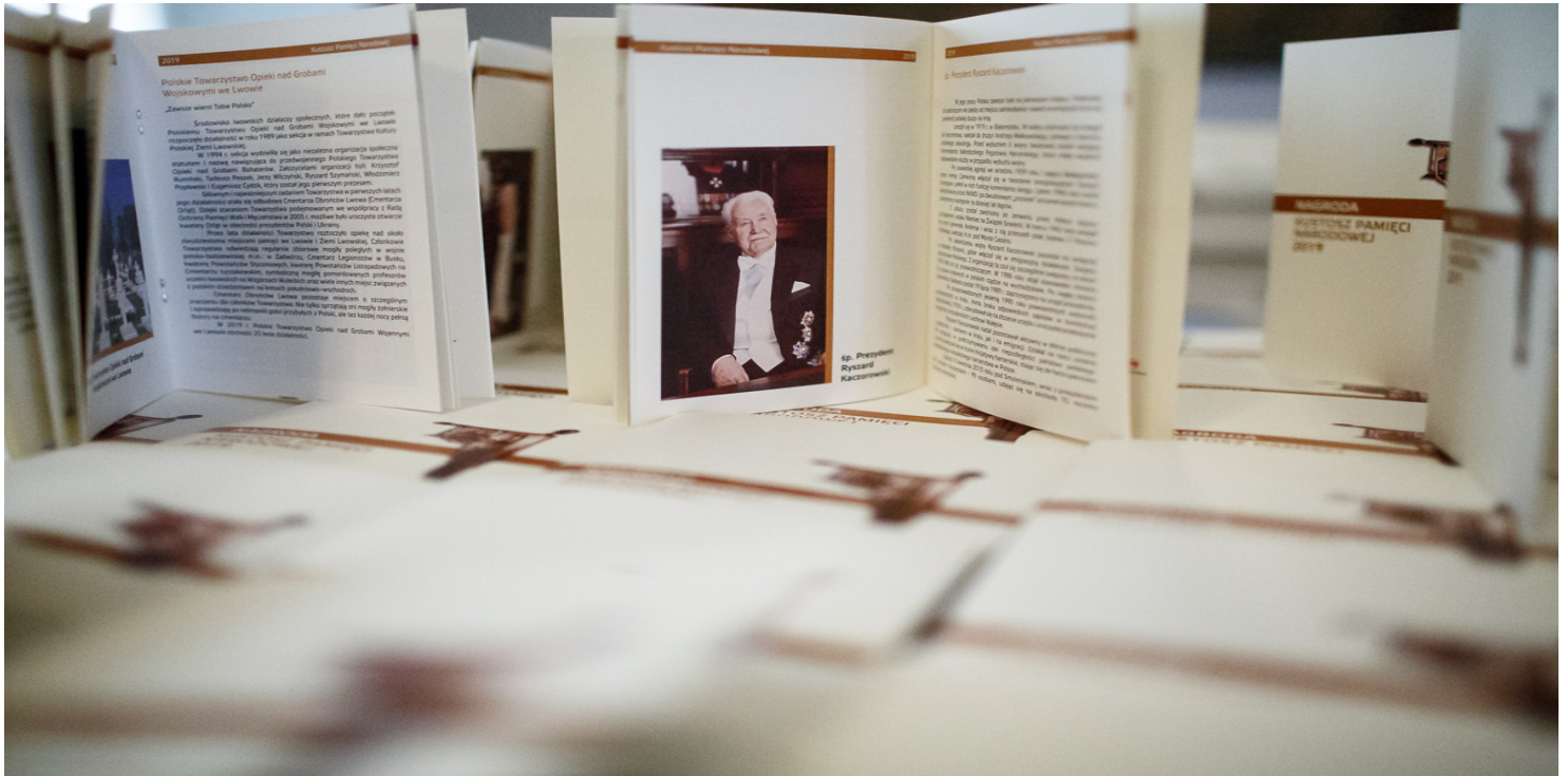
Gala Nagrody „Kustosz Pamięci Narodowej” – 28 maja 2019 r.

https://przystanekhistoria.pl/pa2/tematy/ryszard-kaczorowski/95632,Zylismy-nadzieja.html