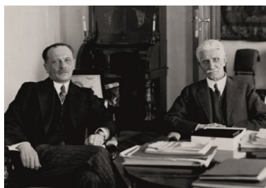
Ignacy Daszyński z premierem Kazimierzem Świąłowskim, który wizytował marszałka czwartego dnia po objęciu stanowiska, kwiecień 1929 r.