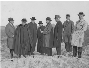
Członkowie Komitetu Budowy Kościoła Opatrzności Bożej w Warszawie. Abp Adam Sapieha (drugi z lewej), kard. August Hlond (trzeci z lewej), Ignacy Daszyński (trzeci z prawej), 1928 r.

Daszyński, jeden z najważniejszych liderów polskiego socjalizmu, daleki był od ideologicznego dogmatyzmu. Mimo wyrazistych poglądów był człowiekiem kompromisu, absolutnie wyzbytym ambicji sprawowania władzy. Jako przywódca Polskiej Partii Socjalno-Demokratycznej Galicji i Śląska Cieszyńskiego zasiadał w austriackiej Radzie Państwa. Walczył o socjalizm, ale daleki był od metod rewolucyjnych. Idea nie przesłaniała mu realnych problemów robotników.