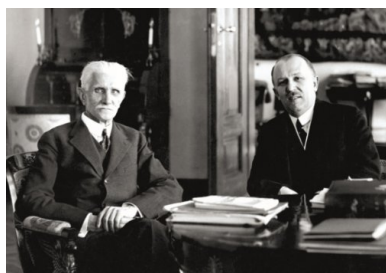
Ignacy Daszyński z prof. Kazimierzem Bartłem, kierującym rządem po raz czwarty (od 27 czerwca 1928 do 13 czerwca 1929 r.), czerwiec 1928 r.

W burzliwym okresie związanym z tzw. wyborami brzeskimi, kiedy aresztowano posłów opozycji, Daszyński apelował o ich uwolnienie. Pogarszający się stan zdrowia uniemożliwiał mu podejmowanie większej aktywności politycznej.