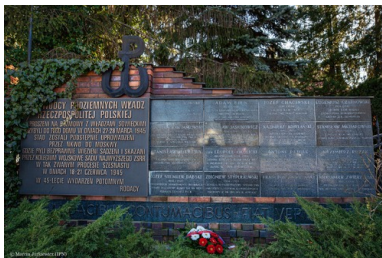
Pomnik szesnastu przywódców Polskiego Państwa Podziemnego

Po wybuchu wojny niemiecko-sowieckiej oraz podpisaniu umowy Sikorski-Majski, 10 września 1941 Pużak zgłosił Delegatowi Rządu RP na Kraj czasowe wstrzymanie się WRN od udziału w PKP. Głównym powodem decyzji kierownictwa WRN, była próba wymuszenia na: premierze, Delegacie Rządu, PKP i SL realizacji zarysowanego powyżej programu. Zakończyła się ona niepowodzeniem głównie z powodu powstania w tym czasie organizacji Polskich Socjalistów, jednoczącej niewielkie konspiracyjne grupy lewicy socjalistycznej, która wkrótce potem została zaproszona do PKP. Uświadomiwszy sobie nieskuteczność podjętej polityki, począwszy od wiosny 1942 r. kierownictwo WRN podjęło wielotorowe działania mające na celu powrót do PKP. Jednocześnie prowadzono rozmowy zjednoczeniowe z organizacją Polskich Socjalistów, które wiosną 1943 r. doprowadziły do jej rozbitcia i przejścia części jej działaczy do WRN. Zbiegło się to z powrotem Pużaka do porozumienia stronnictw. W ciągu kilku kolejnych miesięcy Pużakowi udało się doprowadzić do podpisania 15 sierpnia 1943 r. Deklaracji Porozumienia Politycznego Czterech Stronnictw, która zawierała zarówno cele wojenne Polski, jak i zakładała utworzenie konspiracyjnego surogatu parlamentu – Rady Jedności Narodowej (RJN). Stronnictwa zobowiązały się także do ścisłej współpracy co najmniej do czasu ogłoszenia pierwszych powojennych wyborów.