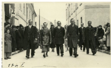
Maszeruje PPS.

Ostatecznie kwestia stosunku PPS do jakiegokolwiek formy uczestnictwa w jednolitofrontowej inicjatywie komunistów została uregulowana podczas XXIV Kongresu socjalistów w Radomiu (31 stycznia–2 lutego 1937 r.). Ostatni w dziejach II Rzeczypospolitej Polskiej Zjazd PPS w kwestii komunistycznej powielił w przyjętej platformie politycznej partii zapisy rezolucji Rady Naczelnej PPS z listopada 1936 r. dotyczące negatywnego stosunku do Kominternu. W ciągu kilku miesięcy zapadły kolejne decyzje potwierdzające stanowisko władz kongresowych. Najpierw w październiku 1937 r. w Warszawie zaakceptowała je partyjna konferencja, a następnie, odrzucając możliwość jakiegokolwiek kooperacji z komunistami, potwierdziła je listopadowa RN PPS.