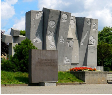
Pomnik na placu Stu Straconych w Zgierzu.