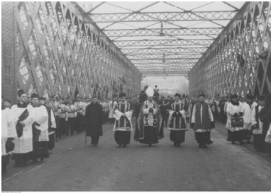
Pogrzeb Romana Dmowskiego w Warszawie w 1939 r.

państw koalicji odnotowano wiele analogicznych deklaracji oraz inicjatyw, skutkujących dalekosiężnymi konsekwencjami po wojnie. I tak, zawarte we Włoszech porozumienia między przedstawicielami południowych Słowian przesądziły o powstaniu późniejszej Jugosławii; podobnie porozumienie Czechów i Słowaków (Pittsburgh, maj 1918 r.) poprzedziło proklamowanie Czechosłowacji. Deklaracja wersalska stanowiła ważny etap na drodze materializacji politycznych wizji Dmowskiego, zapowiedź utworzenia późniejszej II Rzeczypospolitej. Jej ogłoszenie było związane ściśle z działaniami Dmowskiego na rzecz przyznania Polsce statusu alianta państw zachodnich. Ostateczny sukces tych działań stanowił kolejną, historyczną zasługę Dmowskiego.