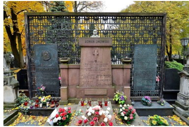
Grób Romana Dmowskiego, cmentarz Bródnowski w Warszawie.