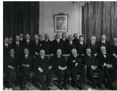
Roman Dmowski (stoi piąty od lewej) na konferencji wersalskiej, 1919 r.

W początkach XX stulecia dawna Rzeczpospolita była tylko wspomnieniem. Na jej wschodnich terenach Polacy stanowili mniejszość, niepewną swojej przyszłości w coraz bardziej wrogim otoczeniu. Ich przeciwnikiem nie były jedynie władze carskie, lecz i lokalne ruchy narodowe, litewski oraz ukraiński, budujące swą siłę raczej na walce z polskością niż na przeciwstawianiu się Rosjanom. Na zachodzie, w zaborze pruskim, polskość cofała się w obliczu skutecznej akcji germanizacyjnej. Pogłębiały się różnice nawet między Polakami zamieszkującymi odrębne zabory.