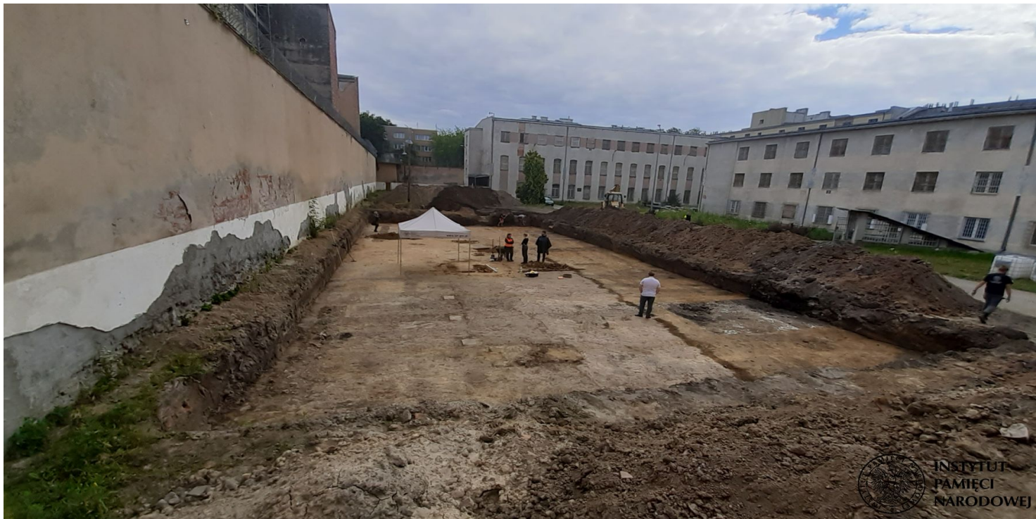
Prace poszukiwawcze IPN w dawnym więzieniu mokotowskim (Rakowiecka), 2020 r.

https://przystanekhistoria.pl/pa2/tematy/ruch-ludowy/93511,Ludowiec-w-Zrzeszeniu-WiN-Karol-Chmiel-19111951.html